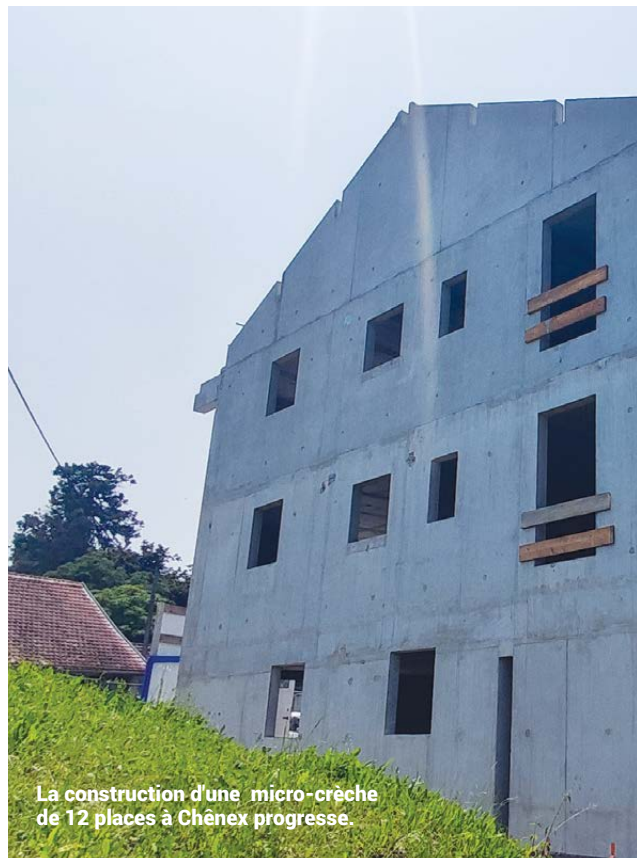
La construction d'une micro-crèche de 12 places à Chênex progresse.

Pour en savoir plus sur le Bail Réel Solidaire, les opportunités dans le Genevois et tester votre éligibilité : www.cc-genevois.fr/logement/accesion-sociale-a-la-proprie