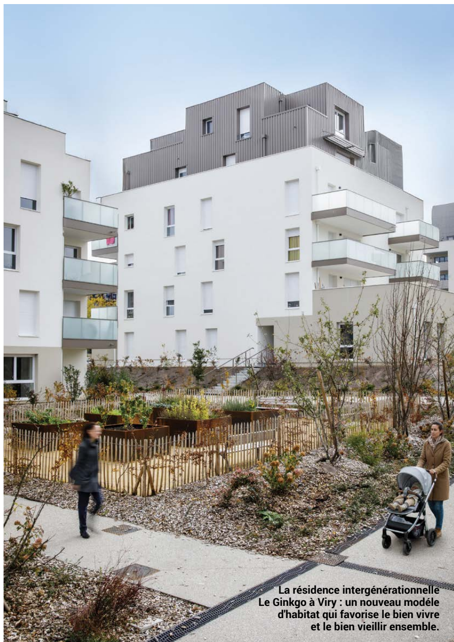
La résidence intergénérationnelle Le Ginkgo à Viry : un nouveau modèle d'habitat qui favorise le bien vivre et le bien vieillir ensemble.

1 habitant sur 4 n'a pas de médecin traitant.