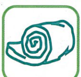
LAINE DE VERRE LAINE DE ROCHE

⊖ Pas de films plastique, pas de carton.