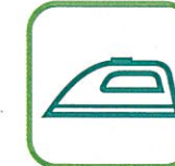
PETITS APPAREILS MÉNAGERS