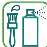
DÉCHETS DANGEREUX DES MÉNAGES