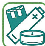
PILES ET ACCUMULATEURS